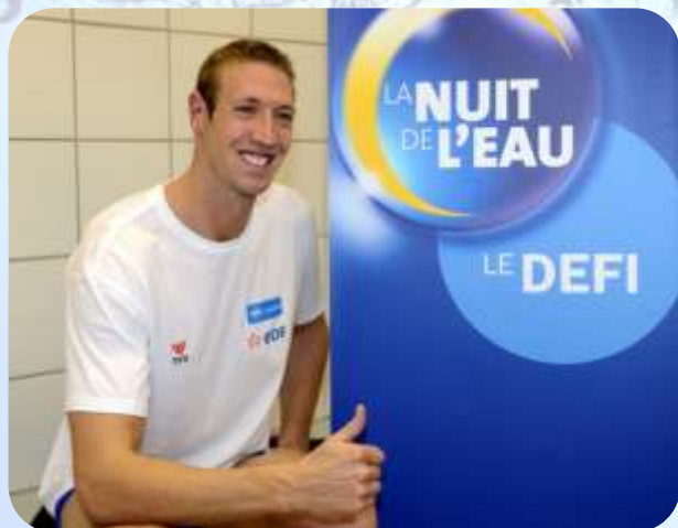
Chaque année, les membres du Team EDF dont Alain Bernard s'engagent avec les salariés EDF sur la Nuit de l'Eau.

Suivez toute l'actualité du Team EDF sur www.facebook.com/teamedf