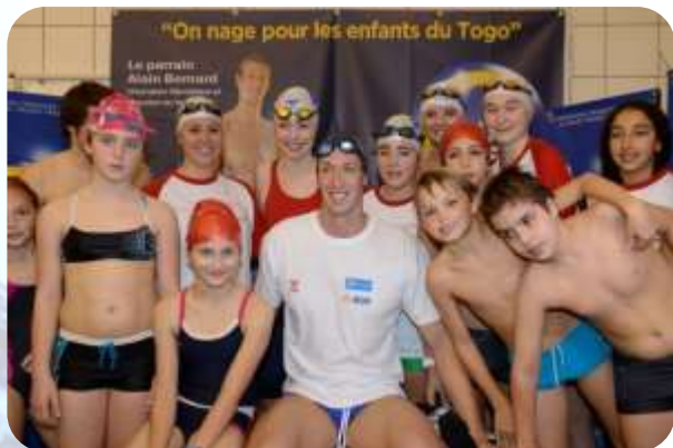
Alain Bernard, parrain de la Nuit de l'eau et membre du Team EDF à Puteaux pour l'édition 2012

Le Team EDF est un collectif de champions olympiques et paralympiques. Ces athlètes qui ont remporté au total 31 médailles (dont 12 en or) lors des derniers Jeux de Londres 2012, continuent de s'engager pour promouvoir le sport et ses valeurs.